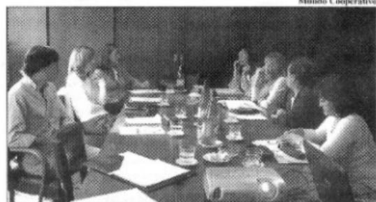
Vista parcial de los participantes de la reunión

dio más detalles acerca del citado Encuentro Nacional de Consejos de Administración de Cooperativas Escolares, quien expresó que trabajarán con el objetivo que "este encuentro sea el espaldarazo definitivo para el desarrollo del cooperativismo escolar en nuestra provincia".